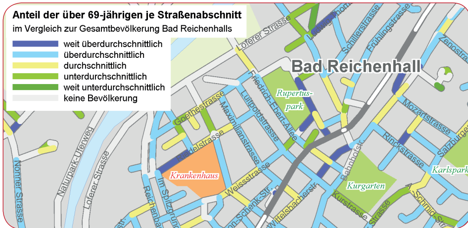
Abb. 1: Anteil der über 69-jährigen auf Straßenabschnittsebene

Für viele Vertriebs- und Planungsaufgaben wird die Betrachtung kleinräumiger Märkte immer wichtiger. Eine wertvolle Unterstützung bieten dabei die Socio Streets Deutschland: umfangreiche Potenzial- und Strukturdaten, die DDS auf Straßenabschnittsebene passgenau für die Digital Data Streets (basierend auf NAVTEQ-Daten) anbietet.