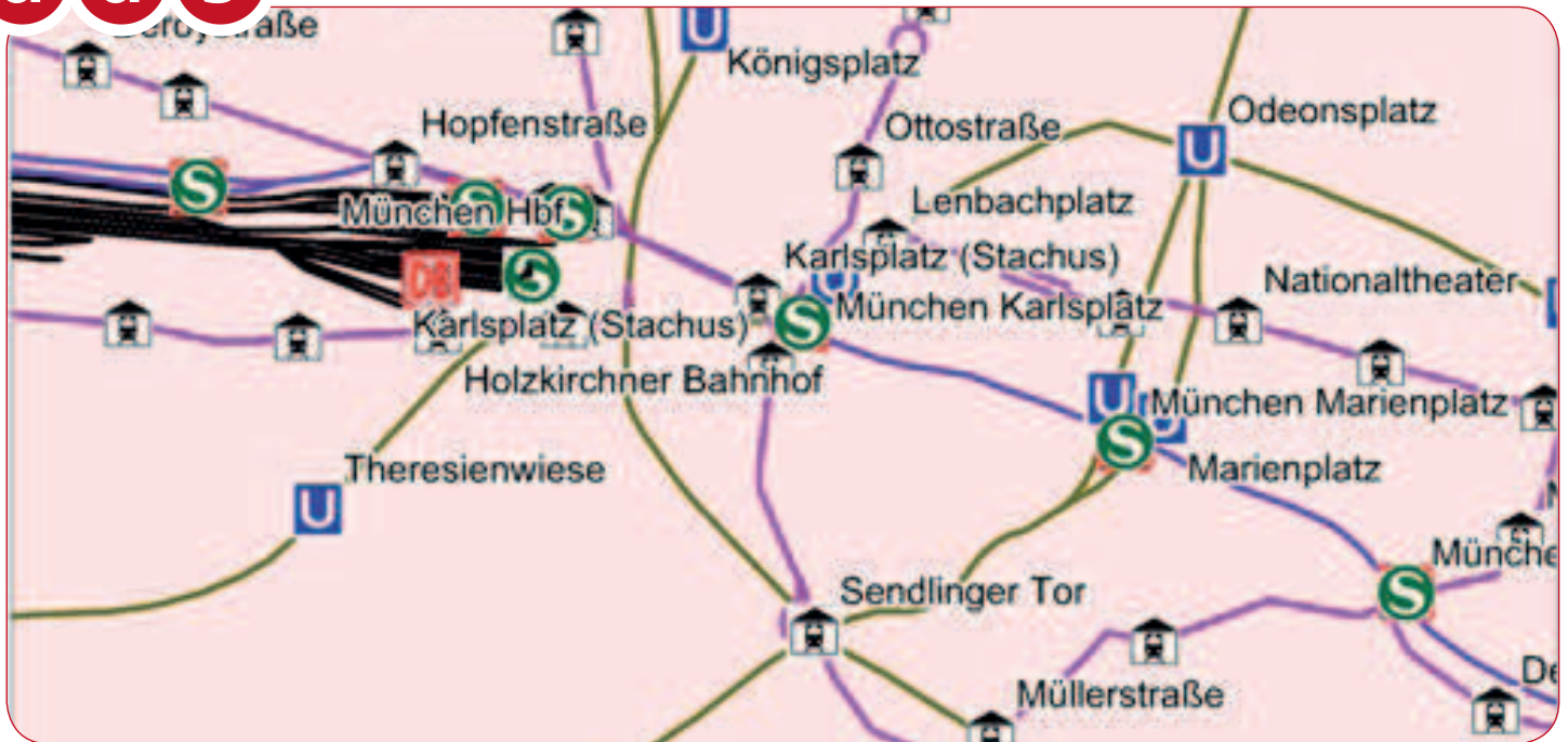
Abb 2: DDS Schienenverkehr am Beispiel der Münchner Innenstadt

Bahn nicht bedient werden. Insgesamt sind ca. 13.600 Haltestellen mit den jeweiligen Lagekoordinaten enthalten. Dem Datensatz kann entnommen werden, welches Verkehrsmittel die jeweilige Haltestelle bedient.